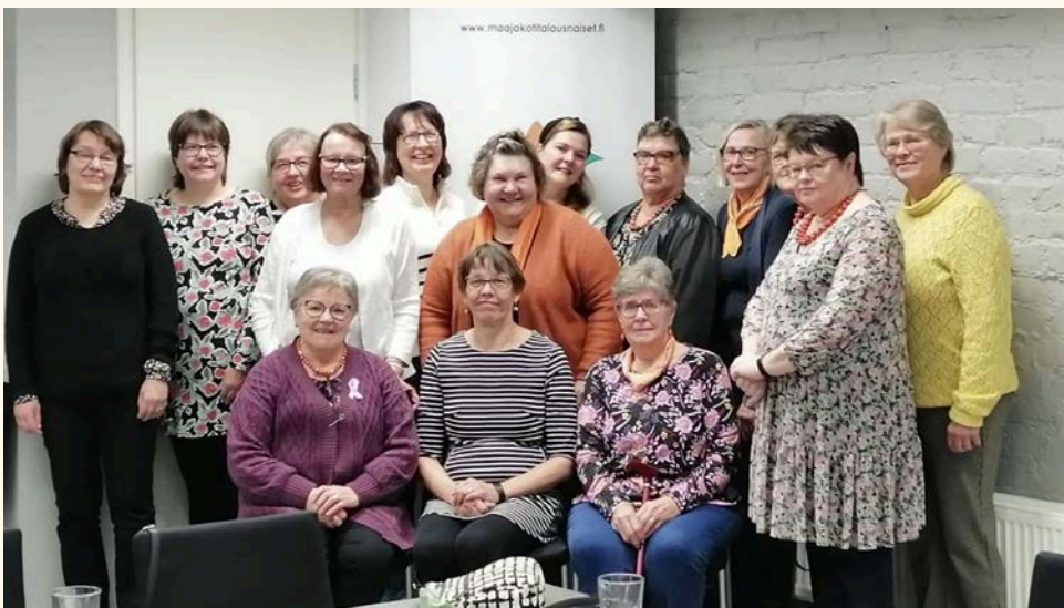
Maa- ja kotitalousnaiset kokoustivat syyskokouksessa Vanhassa paukussa lokakuussa 2025.

Etelä-Pohjanmaan Maa- ja kotitalousnaiset toteuttavat näitä strategisia toiminta-alueita mm. vahvan ja monipuolisen hanketoiminnan kautta. Etelä-Pohjanmaan Maa- ja kotitalousnaiset toimivat Ruokaprovinssi verkoston keskiössä ja tätä työtä jatketaan yhteistyöverkoston kanssa tiiviisti.