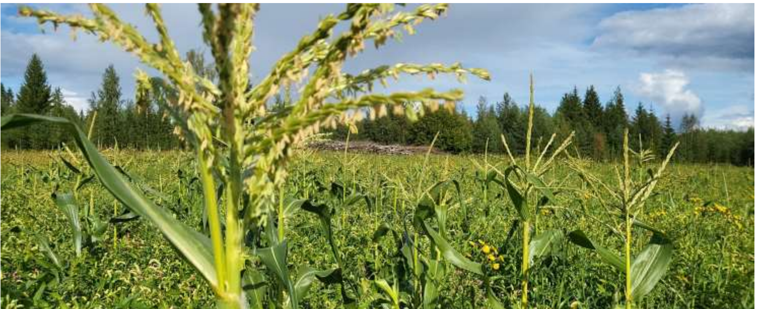
Kotimainen maatalous on merkittävä tekijä varautumisessa, tuottaa se sitten perinteisiä ravintokasveja tai vähän uudempia tuttavuuksia. Maissi kasvaa nykyään myös meillä Etelä-Savossa, kuten tässä puheenjohtajamme Sannin pellolla tänä kesänä.

PS. Piirikeskuksen uudesta varautumishankkeesta voit lukea lisää sivulta 5