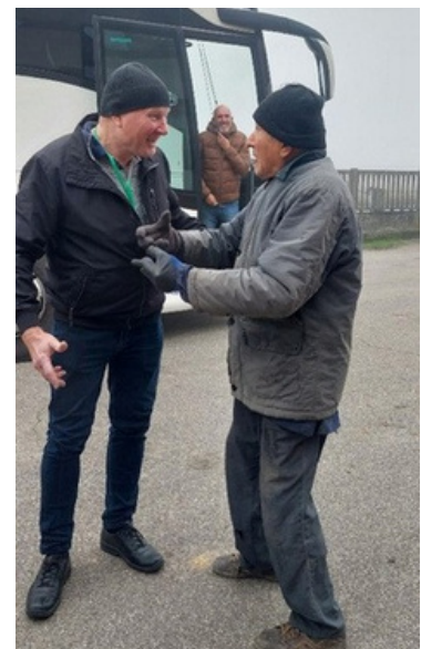
Ford- miesten iloista sanailua

Tilalla oli juuri käynnissä soijan kuivaus ja tila onkin keskittynyt viljan kuivaamiseen ja varastointiin. Vaikka kapasiteettia on kasvatettu, se alkaa olla taas liian pieni pärjätäkseen hyvin markkinoilla. Puinnit olivat vielä kesken, sillä märkä syksy on viivästyttänyt töitä. Osuuskunta on kasvanut ja hankkinut vuokralle hiljattain 600 hehtaaria viljelymaata. Maanmuokkaus on erittäin rajua. Syväkyntöä ja jankkurointia tehdään vuorovuosina. Perusteeksi tälle on maan tiivistyminen ja vesitilan kasvattaminen. Bussimatkoilla näimmekin monia eri muokkaustapoja aina syväkyntöstä lautasmuokkaukseen.