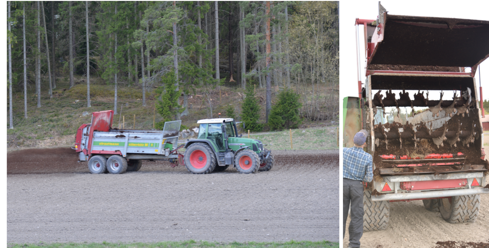
Kuivalannan tarkkuuslevitin tekee tasaista jälkeä, koska repijäkelat hienontavat massan levityslautasille.