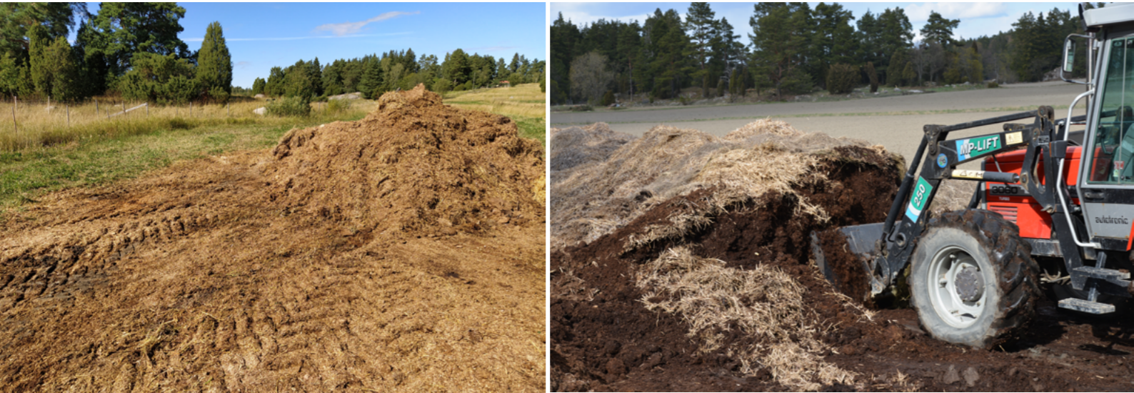
Kuivalanta varastoidaan usein aumassa lähellä levityspaikkaa. Alle kuukauden mittaisesta varastoinnista ei tarvitse tehdä auma-ilmoitusta kuntaan.