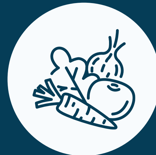
Kasvikset ja sienet