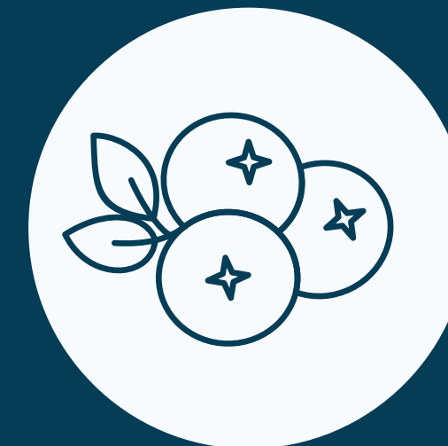
Marjat ja hedelmät