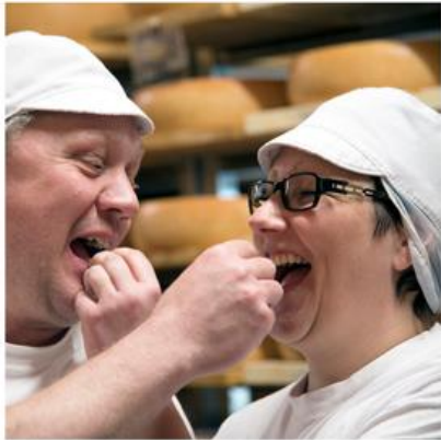
Suomalaisen ruoan sankaritarinat