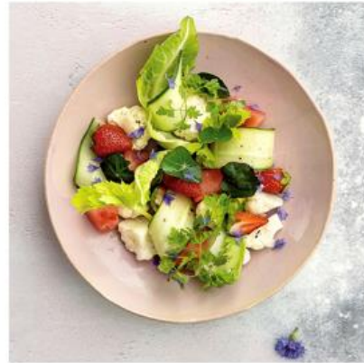
Ilmastomyönteinen ja kestävä yhteiskunta