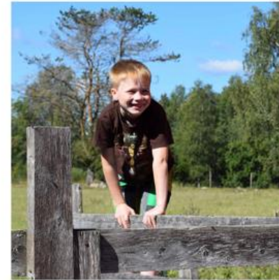
Suomi kutsuu kylään