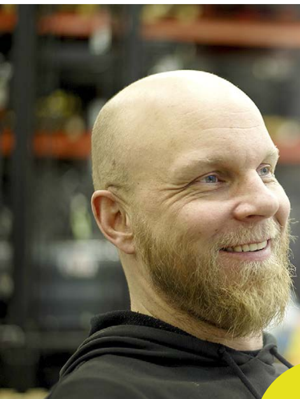
STUDIO JAANA ORJALA