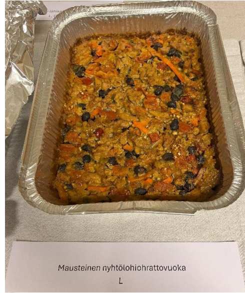
Kuva 4. Ohrattovuoka

Lasagnette sai yleisesti positiivista palautetta, erityisesti ulkonäkö ja rakenne nousivat esille (keskiarvo 4,9-5,0). Kokonaismiellyttävyys arvioitiin korkealle, vaikka maussa oli pientä hajontaa (keskiarvo 4,9). Lasagnette sai kiitosta ulkonäöstään ja maustaan, alkuperäiseen reseptiin kuulumaton chilitomaattimurska sopi ruokaan hyvin ja toi lisää makua.