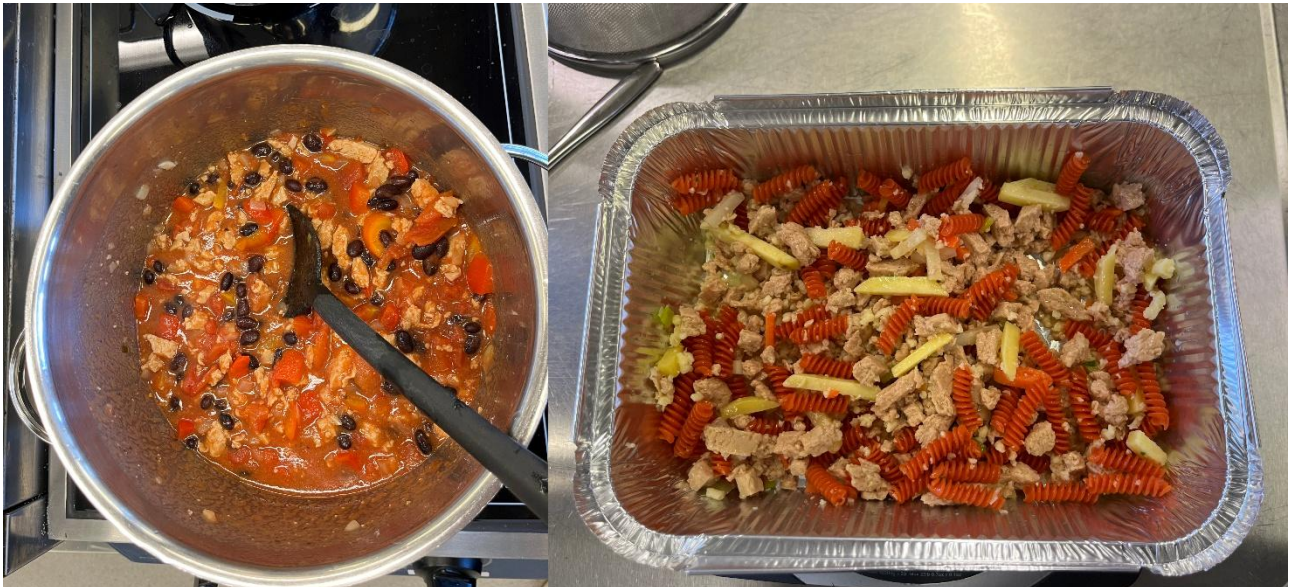
Kuva 5 ja 6. Nyhtölohichili ja nyhtölohilasagnette valmistus vaiheessa