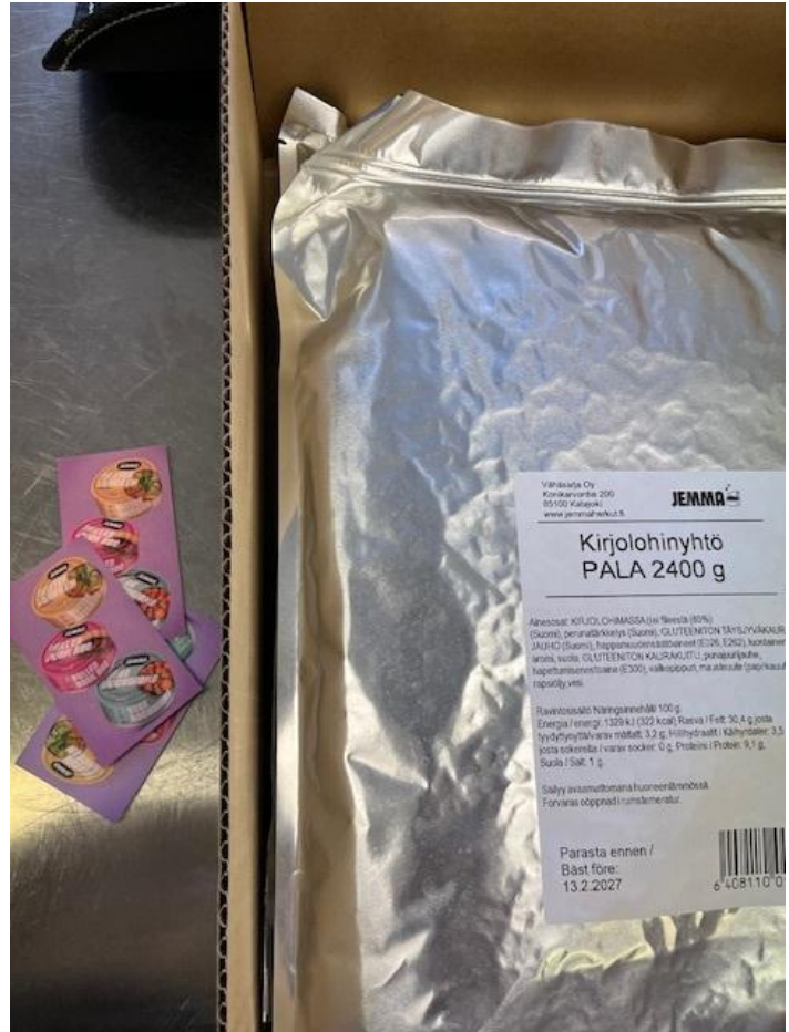
Kuva 10. Jemma Kirjolohinyhtö paketti

Särkipyöryköistä/-pihveistä pidettiin, kokonaismieltyvyys oli keskiarvoltaan 4,0. Tuotteet herättivät erilaisia mielipiteitä, tuotteet eivät olleet kaikkien makuun ja joidenkin mielestä tuotteissa oli liikaa suolaa. Joidenkin mielestä tuotteet olivat kuitenkin miellyttävä uusi kokemus, ja tuotteen suuri kalan määrä oli plussaa.