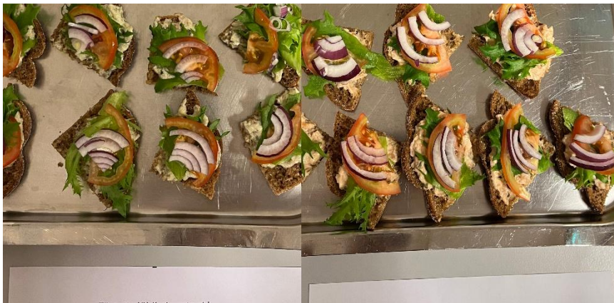
Kuva 8. Patongit

Nyhtölohipatonki oli todella tykätty, erityisesti väri, rakenne, suuntuntuma ja maku oli arvioitu korkeaksi (keskiarvo 5,4). Myös kokonaismieltyvyys ylsi 5,4 keskiarvoon maukkaudellaan sekä täytteiden yhdistelmällä. Makua kuvailtiin kalaisaksi.