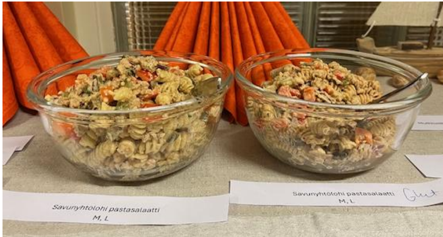
Kuva 7. Savunytölohi pastasalaatti sekä gluteeniton versio linssipastasta.

Pastasalaatti sai kokonaisuudessaan hyvää palautetta, erityisesti rakenteesta, ulkonäöstä ja suuntuntumasta tykättiin (keskiarvo 4,9–5,0). Kokonaismieltyvyys ylsi 4,9 keskiarvoon ja maku 4,8. Makua kuvailtiin makeahkona ja kalaisena. Osa vastaajista kommentoi myös, että voisi käyttää tätä reseptiä tulevaisuudessa. Pastasalaatista valmistettiin myös gluteeniton vaihtoehto.