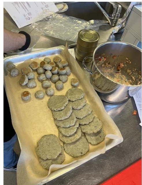
Kuva 11. Borealfoods särkituotteet