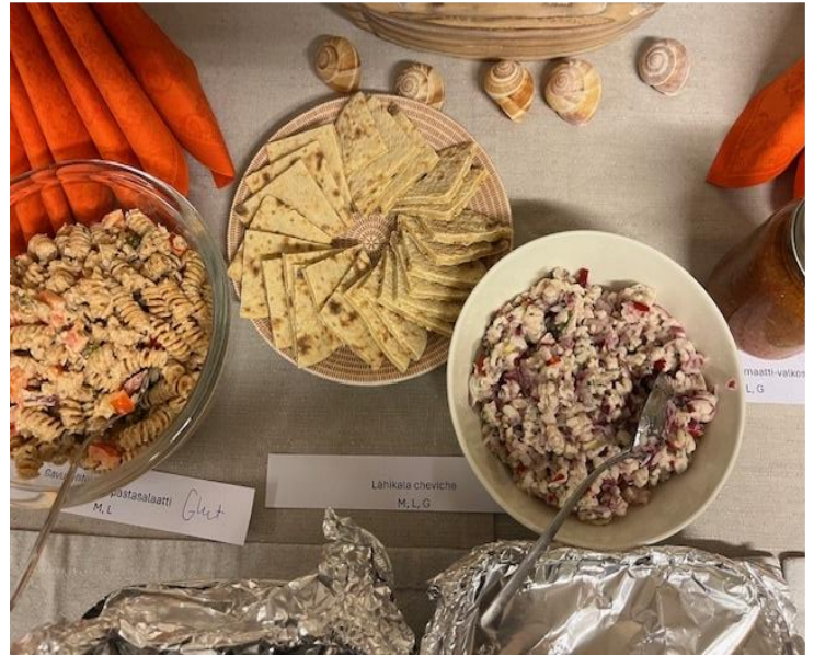
Kuva 1. Lähikala cheviche rieskan kanssa tarjoiltuna

Osallistujat arvioivat lähikala chevichen yleisesti miellyttäväksi. Ulkonäkö, rakenne ja suutuntuma saivat korkeimmat pisteet (keskiarvo 5,2–5,3). Kokonaismiellyttävyys arvioitiin erittäin korkealle (5,3). Makua ja suutuntumaa pidettiin yleisesti miellyttävinä. Annos koettiin raikkaaksi uudeksi tuttavuudeksi, jota voisi tehdä sekä syödä uudestaan. Täyteläisyyden lisääminen voisi parantaa kokonaisuutta, ja osa osallistujista kaipasi lisää suolaa.