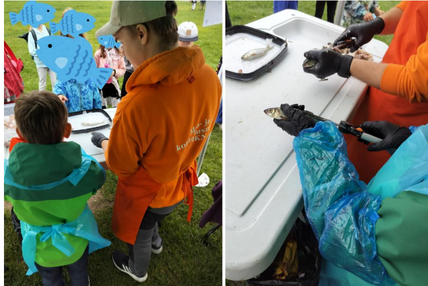
Kuva: Kalankäsittelyyn tutustumista Pelasta Perämeri -päivänä Oulun Kuusisaassa 2025.

kaupunkilaisille. Hanke osallistui Oulun kaupungin, Pohjois-Pohjanmaan ympäristökasvatuksen yhteistyöryhmän (Pyry) ja Bothnian Arcin koollekutsumiin suunnittelupalaveriini keväällä ja syksyllä 2024.