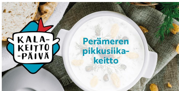
Kuva: Kalakeittopäivään 2025 ideoitin keittoruoka Perämeren pikkusiika.