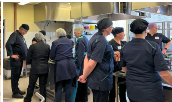
Kuvat: Työpajat Torniossa ja Raahessa.