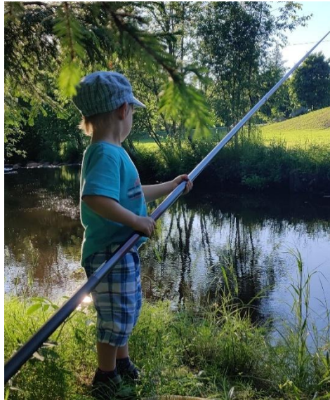
Kuva: Kalamuistoni-kuvakilpailun voittajakuvan otti Oskar.

Kilpailuun saatiin kuusi kuvaa, joista voittaja valittiin hankkeen ohjausryhmän kokouksessa 30.10.2024 äänestämällä. Kuvissa arvioitiin tunnelmaa, mielikuvituksellisuutta ja kalastusta tai lähikalan ruokakäytön esilletuomista innostavasta näkökulmasta. Voittaja palkittiin 100 € arvoisella lahjakortilla kalastusvälinekauppa Eräkontioon. Lisäksi kaikkien osallistujien kesken arvottiin kaksi 50 € arvoista lahjakorttia Eräkontioon ja Tiura Uistimen lahjoittamia tavarapalkintoja. Palkinnot toimitettiin voittajille postitse.