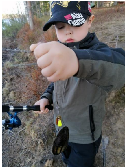
Kuva: Kalamuistoni -arvonnin voittaja.

Arvontaan osallistui 11 henkilöä. kyselylomaketta oli avattu kilpailun aikana 794 kertaa. Arvontaa markkinoitiin kouluvierailulla, yleisö tapahtumissa sekä sosiaalisen median julkaisulla ja maksullisella mainonnalla Facebookissa.