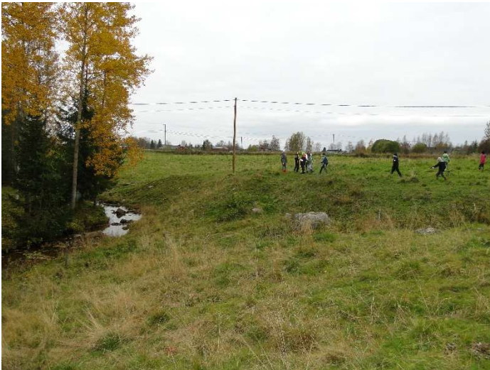
Kuva 1. Maataloudella on merkittävä vaikutus alueen kulttuurimaisemaan

Tämä opas on laadittu ProAgria Pohjois-Suomen/ Oulun Maa- ja kotitalousnaisten hallinnoimassa Kylien maisemahelmet-hankkeessa. Oppaan tarkoitus on antaa vinkkejä kylätoimijoille maiseman- ja luonnonhoidon rahoituksia haettaessa.