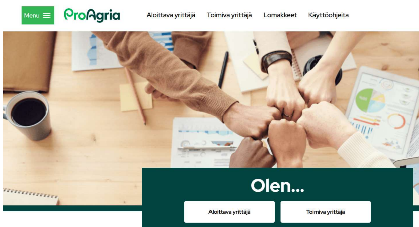
Kuva 11. Tutustu Yritystulkin sivulta valmiisiin sopimus pohjiin.

On myös tärkeää tehdä kaikki sopimukset kirjallisesti. Yritystulkin sivuilta löytyy valmiita sopimus pohjia, joita voi käyttää pohjana ja täydentää kohteen sovitut asiat, mitä tehdään ja milloin työt tulee suorittaa. Tässä on myös hyvä sopia etukäteen vastuut ja korvaukset, jos sopimuksessa ei pysyt. Kirjallisesta sopimuksesta on tarkistettavissa mitä on sovittu ja vältetään mahdollisia väärinymmärryksiä.