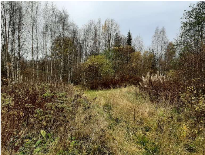
Kuva 7. Kuvassa oleva kohde kunnostettiin luonnonsuojelulain tuella ELY-keskuksen toimesta. Kuvan ottamisen aikaan kohteelle ei ollut vielä tehty kunnostustoimenpiteitä.

Luonnonsuojelulain tuen jälkeen alueen jatkohoito voidaan rahoittaa ympäristösopimuksella.