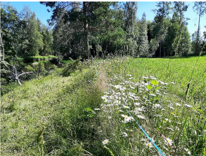
Kuva 2. Maatalousluonnon ja maiseman hoitosopimusta voidaan hakea esimerkiksi joenvarsiniittyjen laidunnukseen.

Rahoitushaku avautuu yleensä keväisin ja ajoittuu samaan ajankohtaan maatalouden muiden tukien kanssa päättyen usein kesäkuun puolivälissä. Päätöksen kohteen rahoituksesta tekee paikallinen ELY-keskus. Sopimukseen haetuille lohkoille tehdään ELY-keskuksen toimesta hallinnollinen tarkastuskäynti eli maastokatselmointi. Maastokatselmointi tehdään viimeistään sopimuksen toisen vuoden aikana. Maastokatselmoinnista tulee hakijalla kuulemispöytäkirja, johon kannattaa tutustua huolellisesti. Kuulemiseen voi tehdä tarpeen mukaan vastineen.