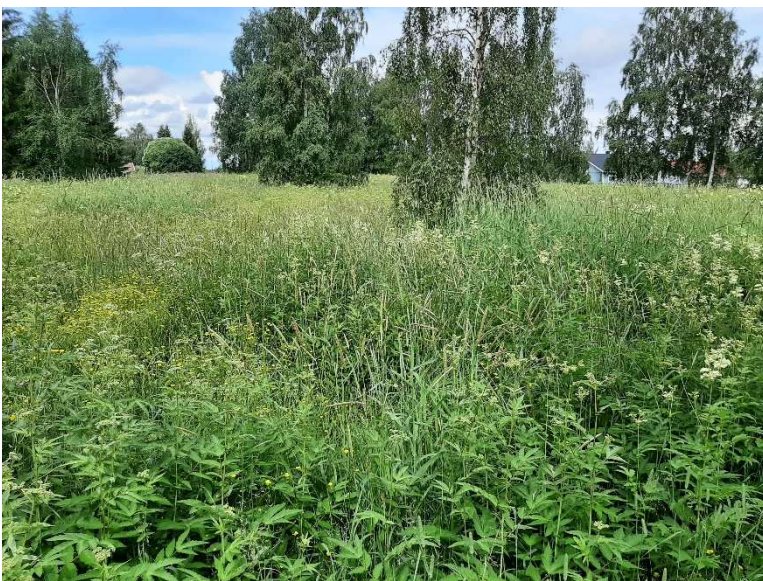
Kuva 8. Esimerkiksi kuvan kaltainen hoidon ulkopuolelle jäänyt niitty voisi sopia Kunta- ja Järjestö-Helmen kautta kunnostettavaksi, jatkohoitoon voisi hakea ympäristösopimusta.

Avustettavien hankkeiden toivotaan myös tuottavan uusia menetelmiä ja toimintamalleja elinympäristöjen hoitoon. Näin ollen tuettaviin hankkeisiin voi sisältyä käytännön hoitotöitä tukevia informaatio-ohjauksen ja viestinnän toimenpiteitä, kuten menetelmien testausta, oppaita tai maastokoulutuksia. Avustuksella ei rahoiteta virkistyskäytön rakenteita tai opastusmateriaaleja lukuun ottamatta tilanteita, jossa suojaavat rakenteet ovat tarpeen uhanalaisen tai erittäin arvokkaan luontotyypin tai lajin suojaamiseksi kulumiselta tai tuhoutumiselta.