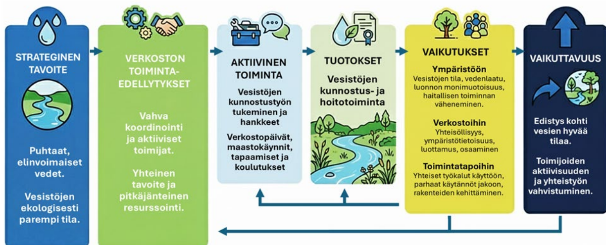
Kuva 1. VYYHTI-verkoston vaikuttavuusmalli koottuna kuvan muotoon.