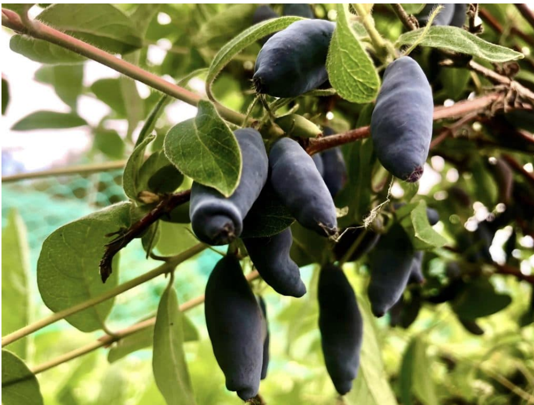
Kuva: Rauhalan luomumarjatilán kotisivuilta.