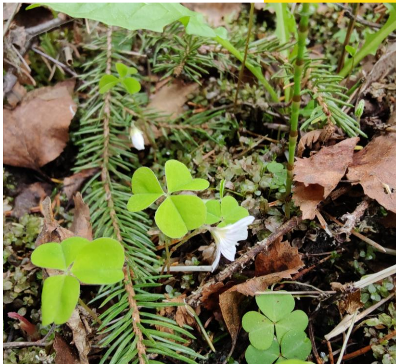
Kuva: Mia Setälä