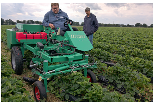
Heuling on kehittänyt mansikan yksiriviviljelyyn soveltuvan itsekulkevan rönsyleikkurin

Glantzin tilalla mansikat tuotetaan avomaalla, joista noin 30 ha katetaan siirreltäville tunneleilla. Satokautta säädelään myös lajikevalinnoilla. Taimet istutetaan yhteen riviin ja taimista otetaan satoa yleensä kaksi vuotta. Istutusvuonna kukat poistetaan. Mansikoita hoidetaan hyvin intensiivisesti ja tänä vuonna satoa saatiin noin 3 miljoonaa kiloa, joten keskiarvotilalla oli noin 18 tn/ha. Tämän vuoden keskihintaan (7 €/kg) oltiin tilalla hyvin tyytyväisiä. ●