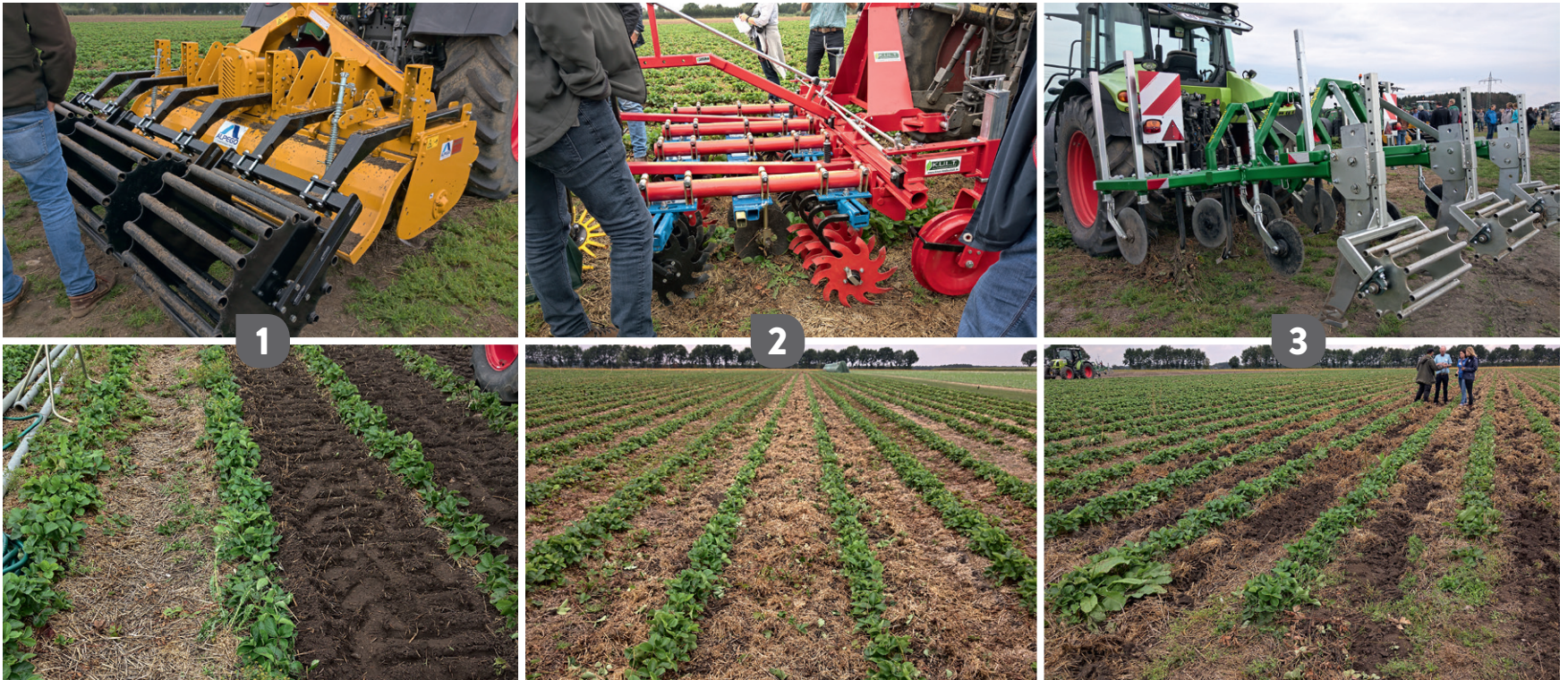
1. Vasemmalla olevissa kuvissa FG300-riviväljiysimellä voidaan käsitellä kolme riviväliä kerrallaan. Pakkerirullat tasoittavat työnjälkeä. 2. Kressin K.U.L.T. -traktoriharan voi koota mieleisistä komponenteista. Tässä mallissa edessä kulkevat suojakiekot, seuraavana kaksi riviä kiekkoahoroja sekä kiekkoileikkurit rönssyjen leikkaamista varten ja viimeisenä rikkaruohoja pensaan tyveltä torjuvat sormiharat. 3. Metasan ProfiStar-sarjan 3R lautasmuokkaimen edessä kulkevat kiekkoilekkurit leikkaavat rönssyt, hanhenjalkaterillä torjutaan rikkaruohot, kiekkolautaset multaavat oljet ja 50 cm syvyyteen yltävillä jankkuriterillä voidaan jankkuroida rivivälit. Jokaisen teräyksikön korkeutta ja työleveyttä voi säätää erikseen maalajin ja rivivälin mukaan.